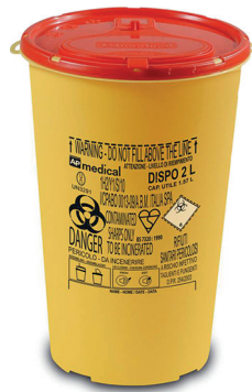
DISPO 2 tuoteno: DISPO2 koko: 2 litraa mitat: kork. 22 cm, ø 14 cm