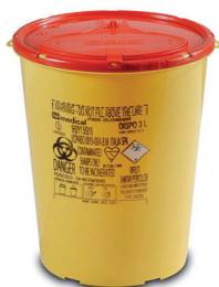
DISPO 3 tuoteno: DISPO3 koko: 3 litraa mitat: kork. 21 cm, ø 17 cm