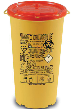
DISPO 1 tuoteno: DISPO1 koko: 1 litra mitat: kork. 19 cm, ø 11 cm