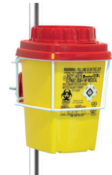
Kärry- /seinäteline CS-sar- jan 2 litran astialle tuotenumero: 1079005100