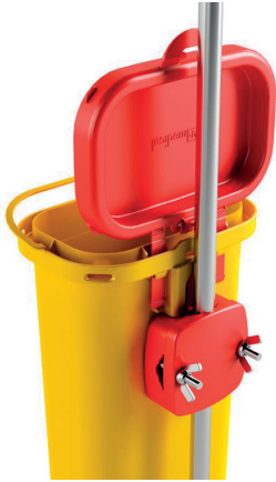
Kiinnitysosa Magnum-astioille tuotenumero: 2901200021102

Särmäisjäteastioihin on saatavilla erilaisia telineitä esim. pöydälle tai kärryyn kiinnitettäväksi. Alla muutamia telinemalleja, kysy lisää asiantuntijoiltamme!