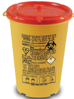
DISPO 0,7 tuoteno: DISPO0.7 koko: 0,7 litraa mitat: kork. 15 cm, ø 11 cm