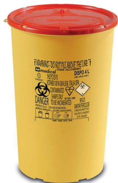
DISPO 4 tuoteno: DISPO4 koko: 4 litraa mitat: kork. 25 cm, ø 17 cm