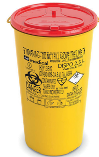
DISPO 2,5 tuoteno: DISPO2.5 koko: 2,5 litraa mitat: kork. 24 cm, ø 14 cm