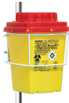
Kärry- /seinäteline CS-sarjan 3/4/5/6 litran astioille tuotenumero: 1079004100