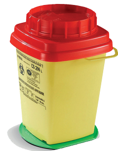
Pöytään tarttuva tuki tuotenumero: 1080013101 Sopii kaikille alla listatuille astioille: CS 2,3,4 ja 5B | CS PLUS 2, 3, 4, 5 ja 5B PBS 1.5 ja 2 | DISPO 2, 3 ja 4