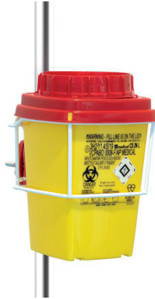
Teline CS-sarjan 2 litran astialle tuotenumero: 2904100042101