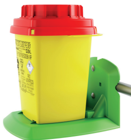
Muoviteline pöytä/seinä/ kärry CS-sarjan 2/3/4/5 litran astioille tuotenumero: 1079013100