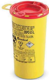
DISPO 0,5 tuoteno: DISPO0.5 koko: 0,5 litraa mitat: kork. 15.1 cm, ø 8.3 cm

Dispo-sarjan särnäisjäteastiat ovat läpäisemättömiä, muodoltaan pyöreitä särnäisjäteastioita. Painokannessa on kaksoissulkumekanismi, eli astia voidaan sulkea väliaikaisesti ja lopullisesti. Kannen leveässä suuaukossa on kolme eri mekanismia neulojen ja insuliinikynien irrottamiseen. Lisäksi astioissa on kahvat kuljetusta helpottamaan. Taloudellinen vaihtoehto turvallisuudesta tinkimättä.