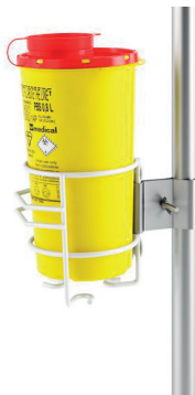
Kärry- /seinäteline BS-sar- jan 0,6 litran astialle tuotenumero: 1079003100