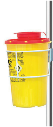
Kärry- /seinäteline PBS-sarjan 1.5 ja 2 litran astioille tuotenumero: 1079002100