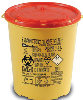
DISPO 1,5 tuoteno: DISPO1.5 koko: 1,5 litraa mitat: kork. 16 cm, ø 14 cm