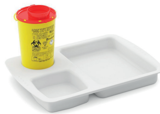
Muovinen tarjotin PSB- sarjan ja CS 2 litran astioille tuotenumero: 1079013101