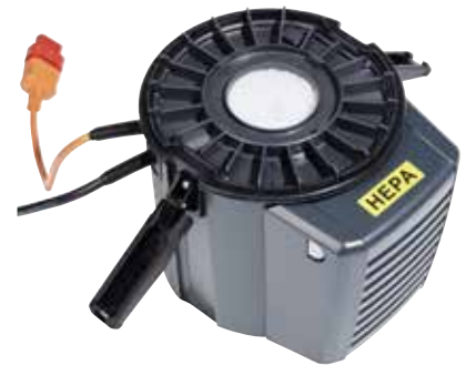
Helposti asennettava HEPA-poistoilmansuodatin on vakiovaruste.