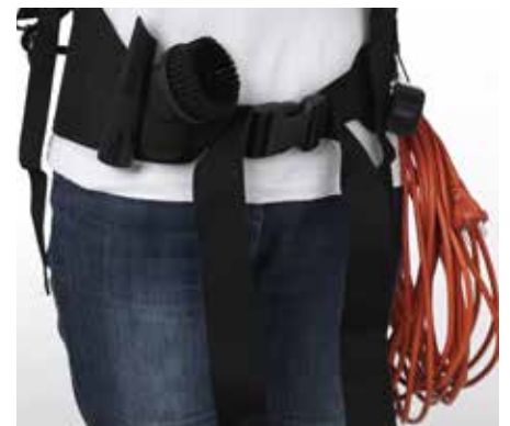
Lisävarusteita kulkevat kätevästi vyössä.