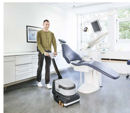
Koneen pesuteho on erinomainen käsimenetelmiin verrattuna.