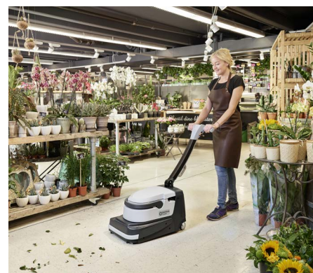
Helppoa ja nopeaa lattioiden puhdistusta - lakaisee, pesee ja kuivaa yhdellä ajolla